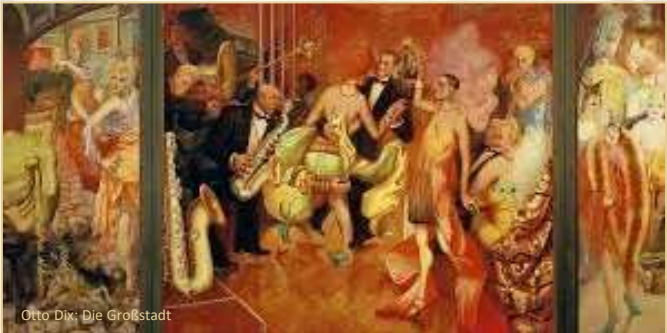
Otto Dix: Die Großstadt